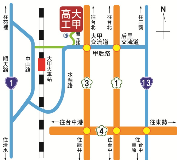
附圖一 承辦學校（臺中市立大甲工業高級中等學校）位置圖